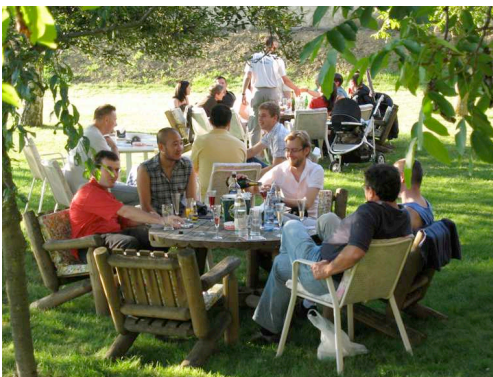
Aperçu du barbecue organisé par RL le 25 août dernier

Les articles signés ne reflètent pas nécessairement l'opinion de l'association.